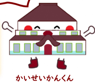
かいせいかんくん